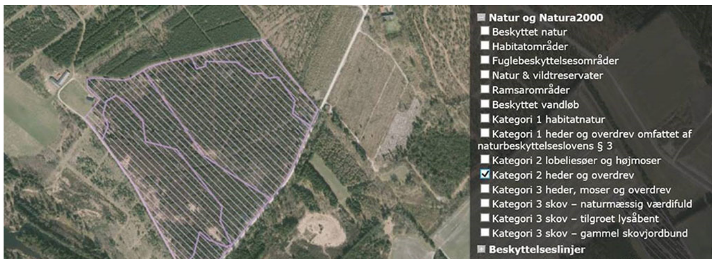
Figur 2. Kort fra it-ansøgningssystemet i Husdyrgodkendelse.dk. Bemærk, at her er laget, der viser kategori 2 heder og overdrev, slået til.