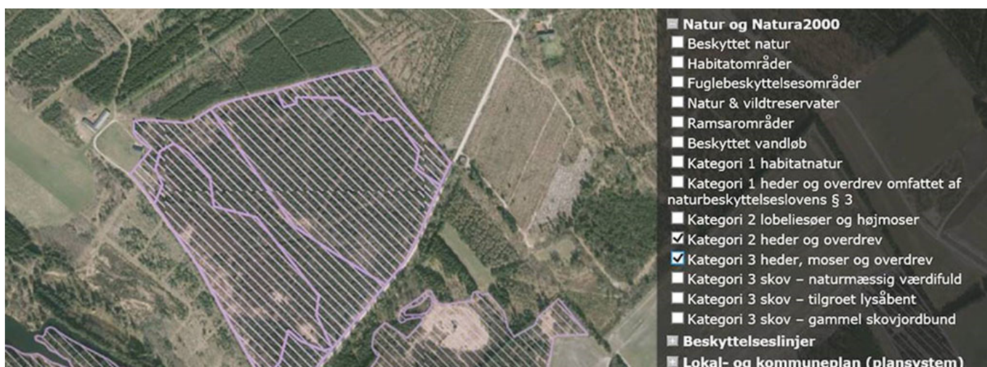
Figur 3. Kort fra it-ansøgningssystemet i Husdyrgodkendelse.dk. Bemærk, at her er begge lag slået til og det reelt ikke muligt at se, at arealet forekommer i begge lag.

Hvis man i Husdyrgodkendelse.dk lægger lagene på et efter et, mens man indsætter naturpunkter, ser man IKKE denne dobbeltregistrering, medmindre man starter med kategori 1 og arbejder sig ned mod kategori 3. Starter man med kategori 3, som typisk er det, der er tættest på ejendommen, og zoomer udad på kortet til kategori 2-1, ser man ikke dobbeltregistreringen.