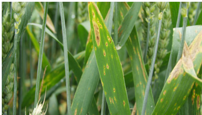
Angreb af hvedebladplet også kaldet DTR.

Ved forfrugt hvede og samtidig reduceret jordbearbejdning kan hvedebladplet være dominerende i afgrøden. Der er derfor ikke "plads" til Septoria (hvedegråplet), som normalt er problemet i hvede. I andre år har hvedebladplet dårlige udviklingsmuligheder (kulde), og der opstår blandingsinfektioner med både hvedebladplet og Septoria eller kun Septoria. Det er derfor nødvendigt at vælge løsninger, som har effekt mod begge svampe.