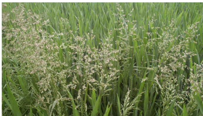
Almindelig rapgræs er en græsukrudsart, som ofte vil kræve en opfølgende bekæmpelse i foråret