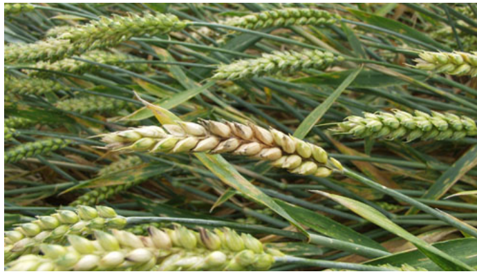
Angreb af aksfusarium viser sig ved, at et eller flere småaks nødmødnere. I fugtigt vejr ses en rødlig svampebelægning.