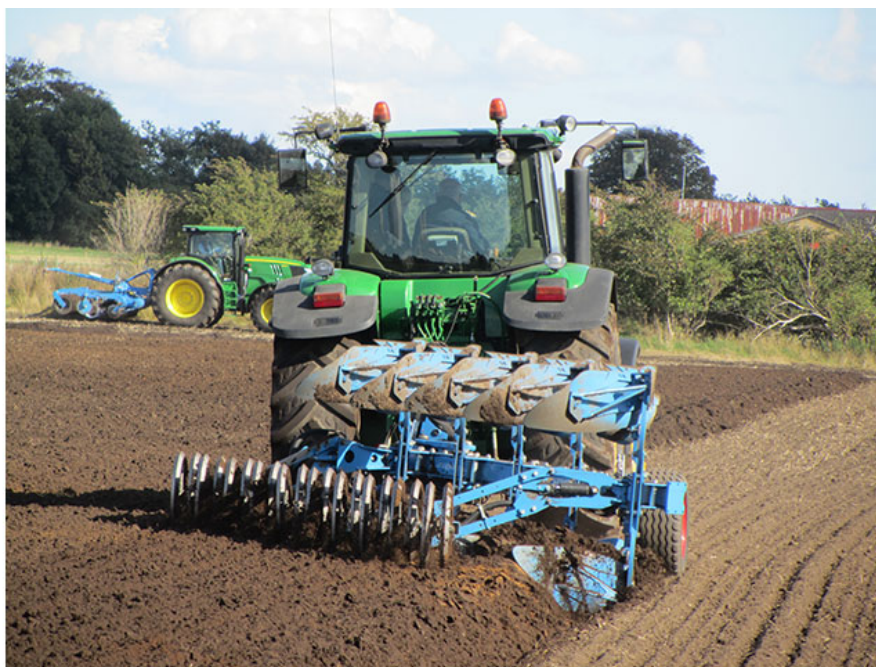
Etablering efter forudgående pløjning er en sikker metode til etablering af vinterhvede under de fleste forhold.

Pløjning reducerer risikoen for angreb af hvedebladplet og Fusarium, når forfrugten er hvede.