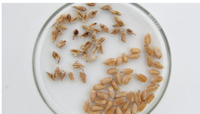
Kerner angrebet af hvedegalmyg øverst til venstre.