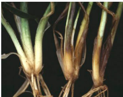
Planter angrebet af knækkefodsyge til højre og en uangrebet plante til venstre.