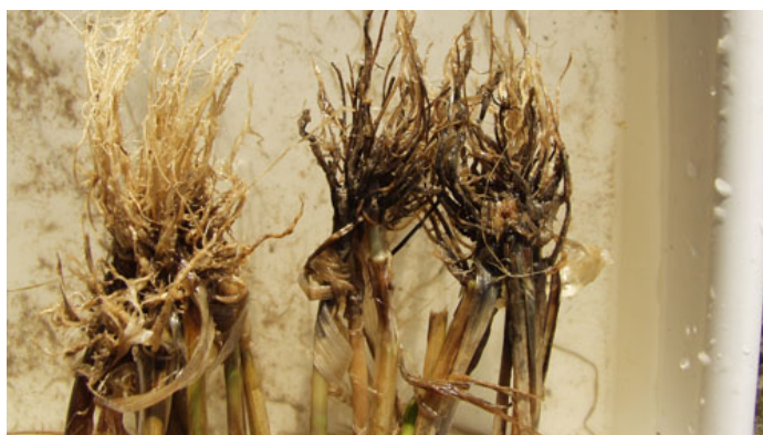
Det er nødvendigt at vaske rødderne grundigt for at afgøre, om goldfodsyge er årsag til nødmodningen. Her ses to angrebne planter til højre og en uangreben plante til venstre.

Det er muligt at importere udsæd af flere sorter, som er bejdsset med svampemidlet Latitude, der har effekt mod goldfodsyge. Bejdsning udsætter angrebet, men bekæmper ikke angrebet fuldstændigt.