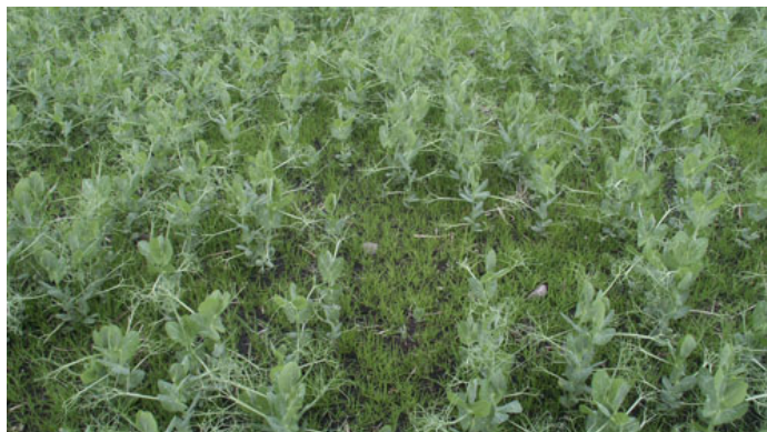
Kombination af en høj andel vintersæd og reduceret jordbearbejdning har medført så stor opformering af enårig rapgræs, at den efterfølgende ærteafgrøde er spiret frem i stort tal.

Ved høj andel af vinterhvede og anden vintersæd i sædskiftet er der en betydelig risiko for opformering af græsukrudt. Der er vekselvirkning mellem andel af vårafgrøder, såtid for vintersæd og jordbearbejdning. Ved tidlig såning, høj andel af vintersæd og pløjefri dyrkning, kan opformering af græsukrudt gå meget hurtigt, hvis bekæmpelse ikke er meget effektiv.