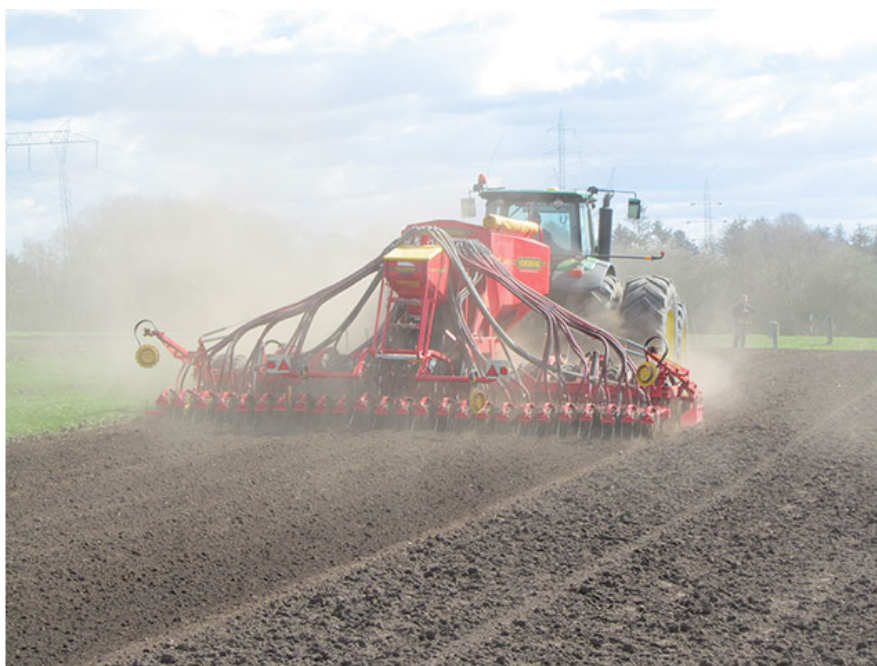
Vinterhvede kan sås fra ca. 1. september til ca. 15. oktober.

Vinterhvede kan sås fra ca. 1. september til ca. 15. oktober, med foretrukken såtid mellem 15. og 20. september. På de fleste lokaliteter vil såning efter 5. - 10. oktober resultere i udbyttetab. Tidlig såning øger behovet for bekæmpelse af ukrudt samt øger risikoen for angreb af f.eks. havrerødsot samt goldfodsyge.