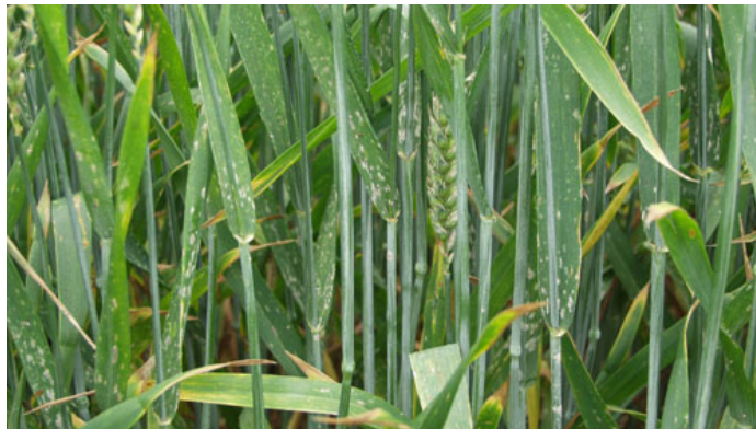
Kraftige meldugangreb ses især på let jord. Foto: Ghita Cordsen Nielsen, SEGES.

I de ikke modtagelige og delvis modtagelige sorter anbefales meldug bekæmpet ved over 25 pct. angrebne planter i vækststadium 29-31 og senere ved over 50 pct. angrebne planter.