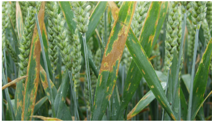
Kraftige angreb af Septoria på fanebladet. Septoria er den vigtigste svampesygdme i hvede og den sygdom, som aksebeskyttelsen oftest er rettet imod.