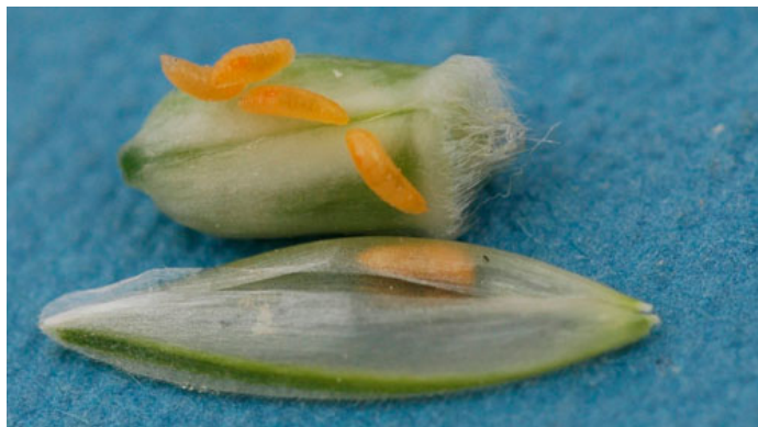
Larver af hvedegalmyg på hvedekerner.

Anvend 1/4 til 1/2 dosis af et godkendt pyrethroid til bekæmpelse. Afsæt et usprøjet vindue for at vurdere effekten af sprøjtningen.