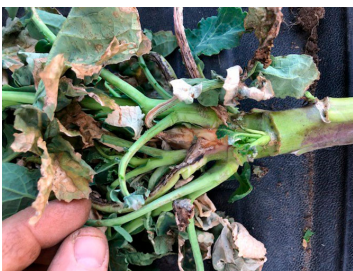
Billede 1. Svidning og efterfølgende angreb af gråskimmel og bakterier fotograferet 20. april 2021 af Anders Smedemand Musse, KHL.