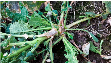
Billede 3. Sekundær angreb af gråskimmel i vinteraps efter svidning. Fotograferet 20. april 2021 af Kirsten Friis Vestergaard, Velas.