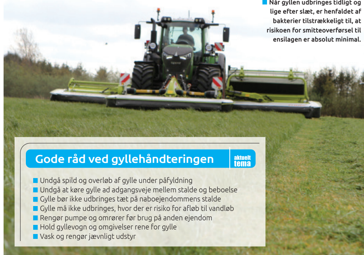
■ Når gyllen udbringes tidligt og lige efter slæt, er henfaldet af bakterier tilstrækkeligt til, at risikoen for smitteoverførsel til ensilagen er absolut minimal.