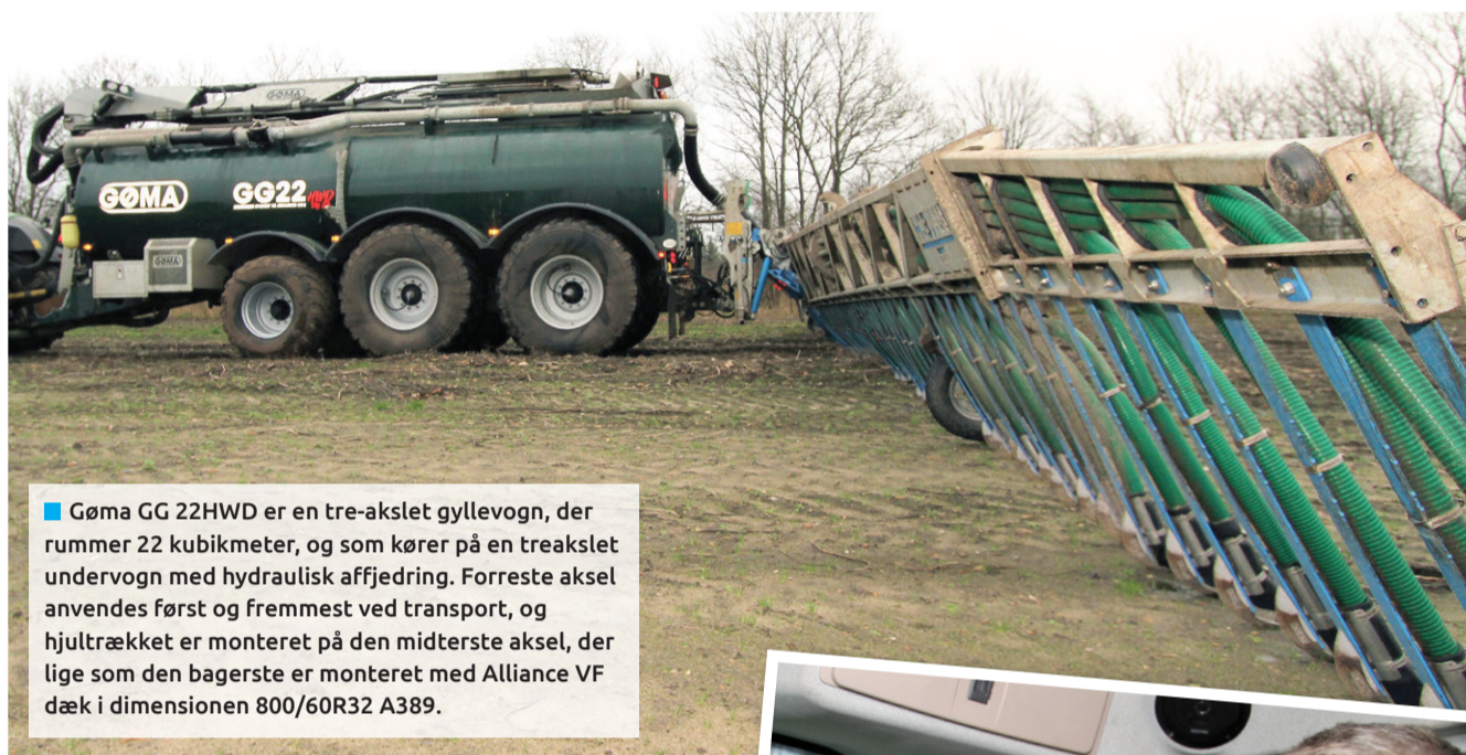
■ Gøma GG 22HWD er en tre-akslet gyllevogn, der rummer 22 kubikmeter, og som kører på en treakslet undervogn med hydraulisk affjedring. Forreste aksel anvendes først og fremmest ved transport, og hjultrækket er monteret på den midterste aksel, der lige som den bagerste er monteret med Alliance VF dæk i dimensionen 800/60R32 A389.

Med to års garanti på gyllevognen og fem års garanti på hjultrækket giver gyllevognen fra Gøma også maskinstationen sikkerhed for minimale driftsomkostninger. Gømas GG 22HWD er en tre-akslet gyllevogn, der rummer 22 kubikmeter, og som kører på en treakslet undervogn med hydraulisk affjedring. De fire bagerste hjul er monteret med Alliance VF dæk i dimensionen 800/60R32 A389 og er 185 cm høje.