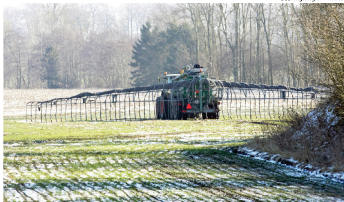
■ Det er ifølge Seges vigtigt, at gyllen er lagret så lang tid som muligt før udbringning.